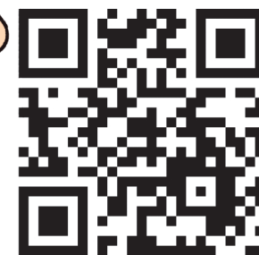
イラスト: 羽海野チカ / 協力: 白泉社